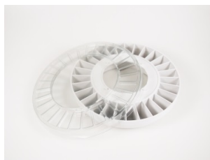
Tablettenring mit Deckel +